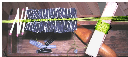
Vävning av armband

Anmälan till Siv Liljeqvist senast 24 september, tfn. 042-236922 eller e-post siv.liljeqvist@telia.com Anmälan är bindande. Avgiften betalas in till Vi Vävares plusgiro 327531-0 senast 24 september 2011.